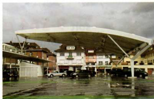
une dépense utile ?