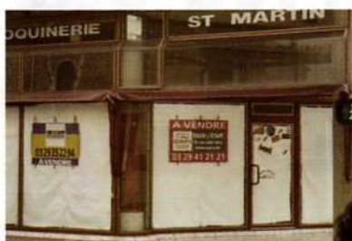
des entreprises qui ferment, des emplois perdus