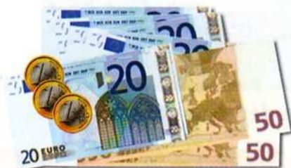
La dette par habitant la plus élevée de Lorraine

Dette par habitant + 80% (3) par rapport à la moyenne des villes de même taille