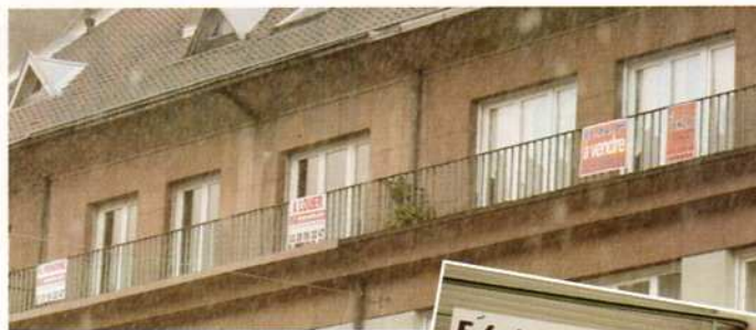
près d'un millier d'appartements ou de maisons à vendre ou à louer