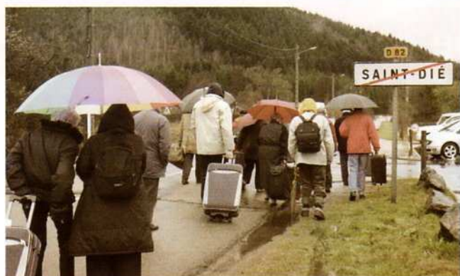
près de 2 000 habitants ont quitté notre ville ces 4 dernières années