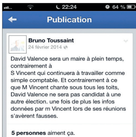
Capture d'écran de Facebook

Cette position a été confirmée à plusieurs reprises par l'intéressé lors de débats télévisés et de réunions publiques.