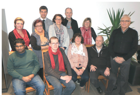
Le conseil d'administration d'UPS

Les élus doivent prendre en compte cette attente, sous peine d'accroître davantage le désarroi de leurs concitoyens.